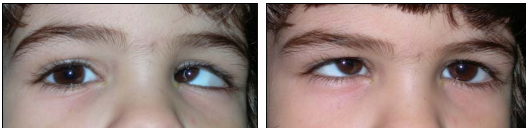
Επαλλάσσω στραβισμός: η προσήλωση γίνεται τότε με το ένα και τότε με το άλλο μάτι. Τα μάτια έχουν «ίση» όραση.

Υπάρχουν πολλές μορφές στραβισμού . Έτσι λοιπόν, ανάλογα με το αν η διαταραχή αυτή της ευθυγράμμισης των ματιών μπορεί να είναι πάντοτε παρούσα ή όχι, έχουμε έκδηλο , διαλείποντα ή λανθάνοντα στραβισμό. Το μάτι που «φεύγει» μπορεί να είναι πάντοτε το ίδιο ή όχι, οπότε η προσήλωση σε ένα αντικείμενο μπορεί να γίνεται μόνο με το ένα μάτι ή να υπάρχει η δυνατότητα προσήλωσης τότε με το ένα και τότε με το άλλο μάτι. Αν σε ένα στραβισμό η προσήλωση γίνεται κάθε φορά με διαφορετικό μάτι, τότε ο στραβισμός χαρακτηρίζεται επαλλάσσω . Όταν συμβαίνει αυτό, αποτελεί ένδειξη ότι η όραση και στα δύο μάτια έχει αναπτυχθεί στον ίδιο βαθμό. Επίσης το μάτι που «φεύγει» μπορεί να είναι στραμμένο προς τα μέσα, έξω, κάτω ή πάνω, οπότε ο στραβισμός χαρακτηρίζεται ως συγκλίνων , αποκλίνων ή κάθετος (υποτροπία ή ανωτροπία).