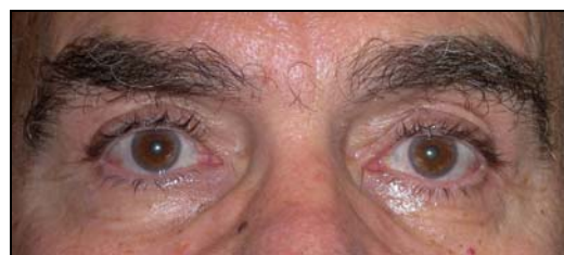
Μετεγχειρητικά (Συνδυασμένη αντιμετώπιση - Βλεφαροπλαστική)