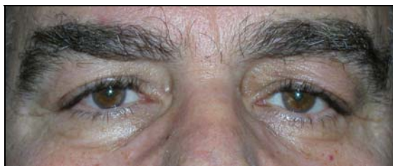
Προεγχειρητικά (Αμφοτερόπλευρη δερματοχάλαση και μικρή βλεφαρόπτωση )