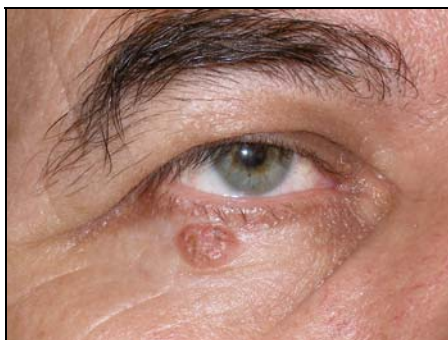
Προεγχειρητικά (Καρκίνωμα βλεφάρου)