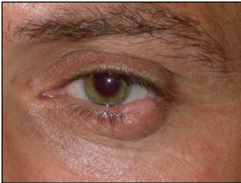
Προεγχειρητικά (Βασικοκυτταρικό καρκίνωμα βλεφάρου)

Οι όγκοι που εμφανίζονται στα βλέφαρα, τόσο οι καλοήθεις, όσο και οι κακοήθεις (καρκίνος) είναι αρκετά συχνοί. Η πρώιμη διάγνωση και η πλήρης χειρουργική αφαίρεση του κάθε όγκου αντιμετωπίζει ριζικά το πρόβλημα στη συντριπτική πλειοψηφία των περιπτώσεων. Ο ειδικός οφθαλμοπλαστικός χειρουργός θα αφαιρέσει τον όγκο και συγχρόνως θα εκτελέσει την κατάλληλη χειρουργική τεχνική (βλεφαροπλαστική) για την καλύτερη δυνατή αισθητική και λειτουργική αποκατάσταση του βλεφάρου.