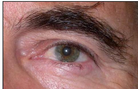
Μετεγχειρητικά (Πλήρης αφαίρεση όγκου - Βλεφαροπλαστική)