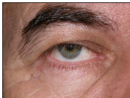
Μετεγχειρητικά (Αφαίρεση όγκου - Βλεφαροπλαστική)