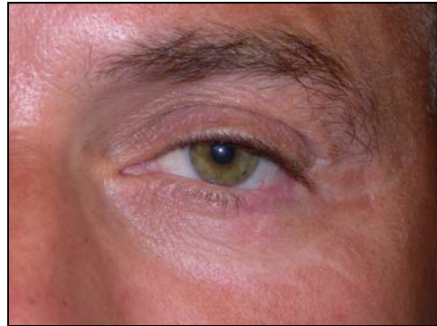
Μετεγχειρητικά (Πλήρης αφαίρεση όγκου, που σημαίνει ίαση - Βλεφαροπλαστική)